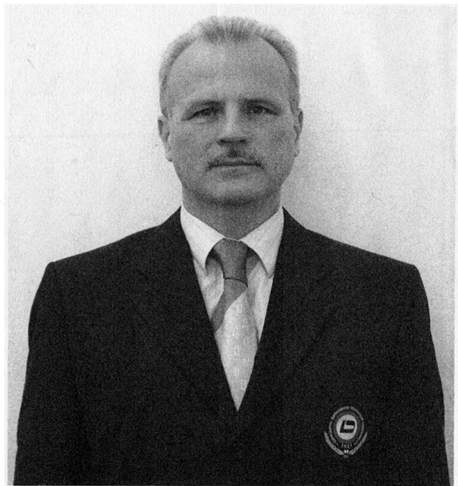
С.Г. Джура (1964–2020)