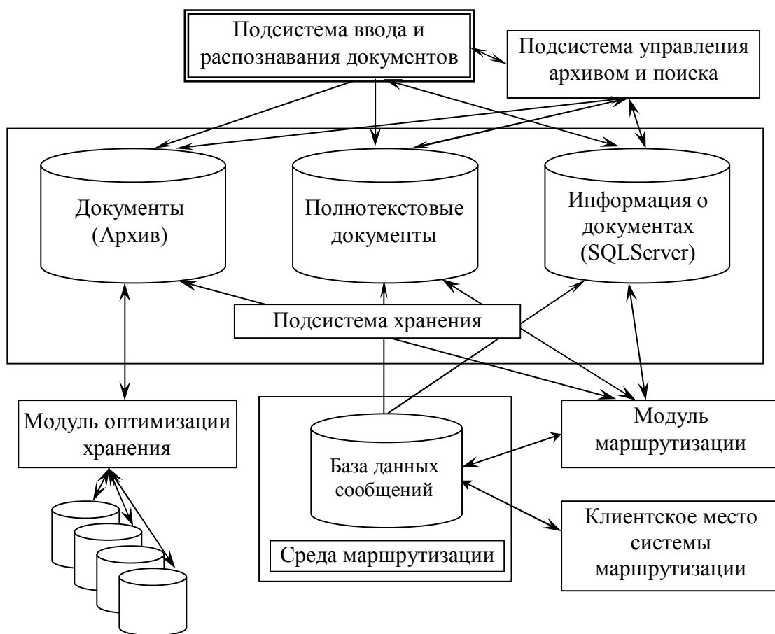
Рисунок 1 – Обобщенная функциональная схема системы формирования, обработки и хранения ЭИР

Во втором разделе «Основные теоретические положения метода автоматического моделирования бинарных растровых цифровых изображений знаков открытых алфавитов» содержатся теоретические основы разработанного автором метода автоматического моделирования образов бинарных растровых цифровых изображений знаков открытых алфавитов, заданных в терминах дискретного множества атомарных элементов.