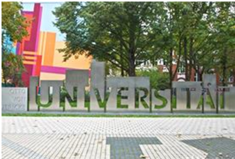
Университет Отто фон Герике

Индии, Пакистана и Бангладеш. Это был бесценный опыт межкультурного общения.