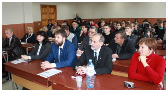
Гости форума «Дни немецкой науки и культуры».