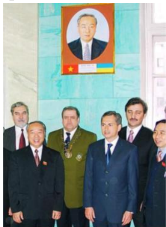
У портрета Галереи почетных докторов

Донецкого национального технического университета, посвященное присуждению звания Почетного доктора ДонНТУ за заслуги перед ВУЗом. Торжество завершилось клятвой нового Почетного доктора ДонНТУ: «Обещаю служить идеалам науки и просвещения!».