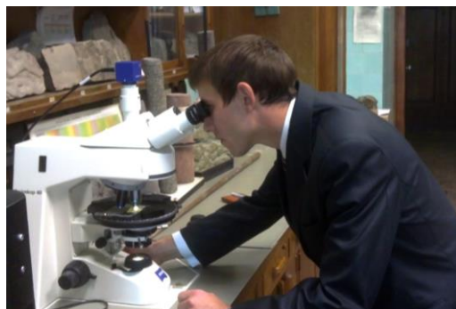
Магистр из ДонНТУ изучает шлифы в проходящем срезе.

Делегат от нашего университета остался под впечатлением от масштабности и загорелся идеей провести подобное мероприятие в родном городе для школьников и абитуриентов. Будем следить за развитием намеченного события.