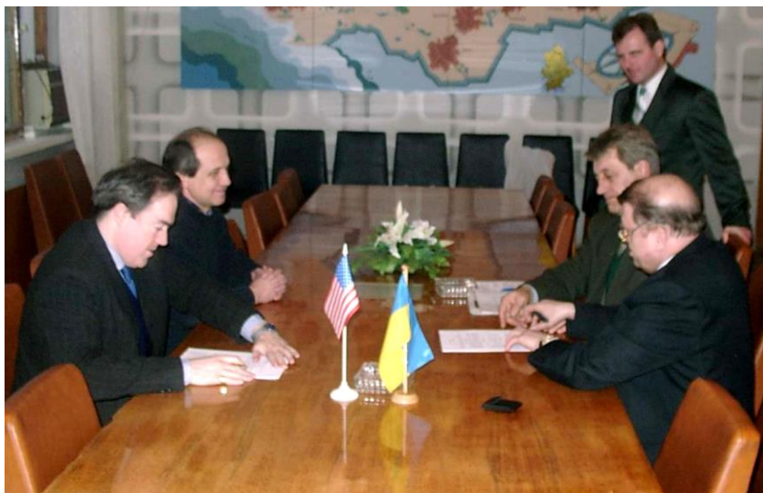
Подписание пакета документов между ДонГТУ и «КАРГИЛЛ АТ»