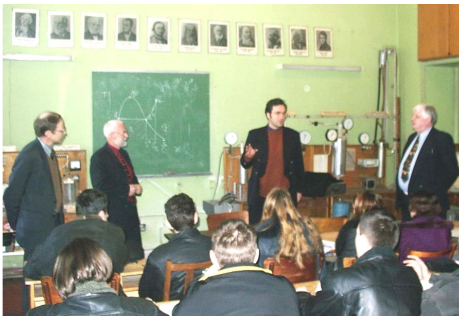
Беседа со студентами группы МЕТ – 98а