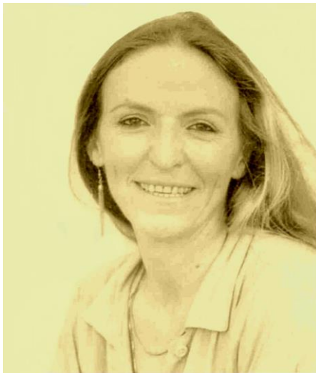
Актриса Пьеррет Дюпуайе

Обладательница самых разных премий, в том числе и премии «Оскар», мадам Дюпуайе побывала более чем в 50 странах мира. Она посетила Украину уже во второй раз, но в Донецком крае побывала впервые. Особенность ее таланта в том, что она актриса жанра «театр одного актера».