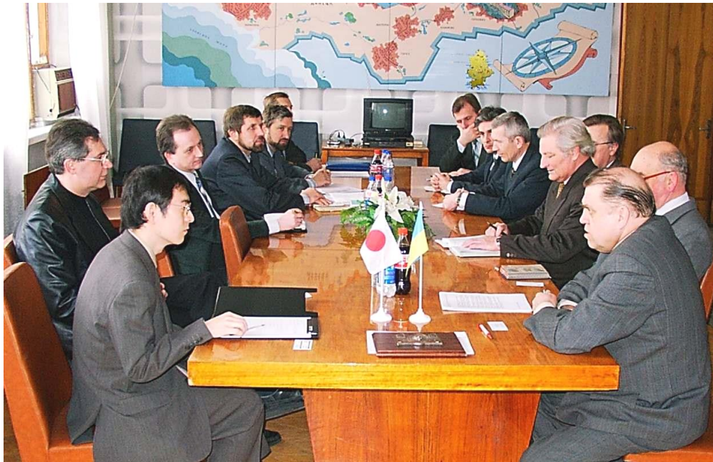
Переговоры с атташе Японии по экономике в ДонГТУ

Это, прежде всего, информационные управляющие системы и технологии, телекоммуникационные системы и сети, компьютеризированные системы медицинской и технической диагностики, ресурсосберегающие и высокие технологии в металлургии и теплофизике, инженерная экология, машиностроение, вопросы управления качеством продукции. В выступлениях высказывались пожелания в установлении широких контактов с Японией: академических, научных, институциональных, коммерческих, культурных партнерств.