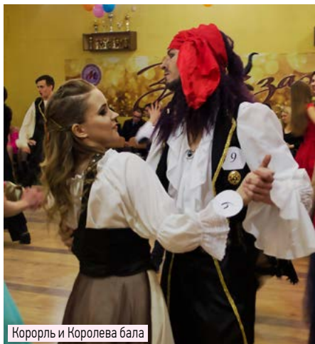
Король и Королева бала

В Донецком городском молодежном центре состоялся традиционный Городской студенческий бал 2019 года. Его организаторами выступили принимающая сторона и отдел молодежной политики администрации г. Донецка.