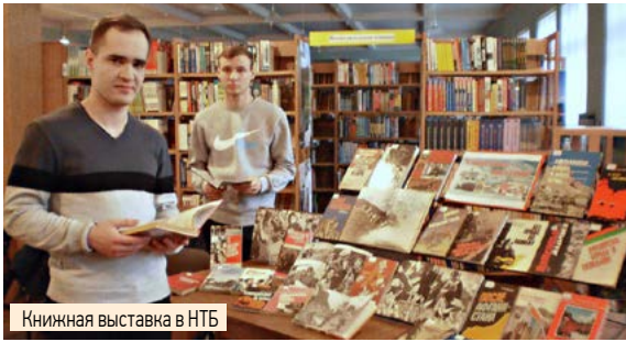
Книжная выставка в НТБ

В научно-технической библиотеке прошел цикл мероприятий «Солдат войны не выбирает», посвященный 30-й годовщине вывода советских войск из Афганистана. Сотрудники НТБ к этой дате подготовили мероприятие «В сердцах и книгах – память о войне», на котором студенты и преподаватели прочитали стихи о войне в Афганистане, воссоздавая картину того времени через поэтические произведения и видеофрагменты.