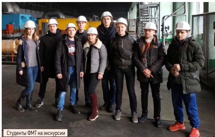
Студенты ФМТ на экскурсии